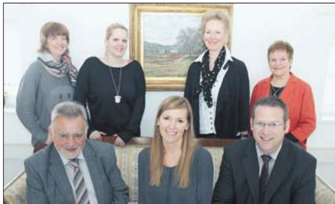
Kompetenz im Team – Meermann Immobilien

...sind unsere obersten Unternehmenswerte! So denken und so handeln wir auch“, darüber sind sich im Hause Meermann alle Mitarbeiter einig. „Unser Ziel ist es, in stadtnaher Lage attraktiven Wohnraum zu schaffen, das geht in der Werler City ebenso wie in Bad Sassendorf am Kurpark.“